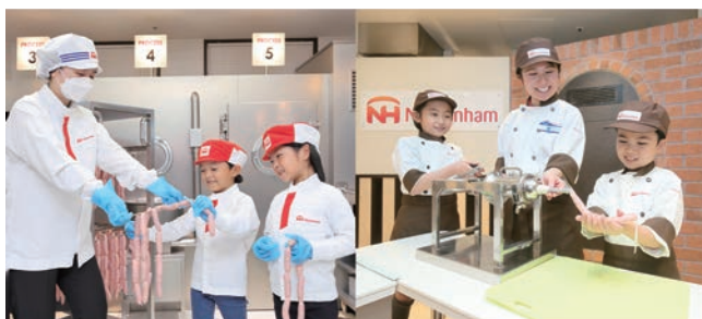
© & © KidZania 2023 / © KCJ GROUP