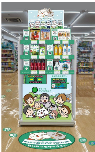
特設棚イメージ ※仕様は変更になる場合がございます。