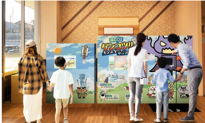
仕掛けイメージ ※仕様は変更になる場合がございます。