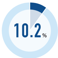
売上高構成比 Share of Net Sales for FY2019