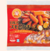
『ロルフ スモークチーズ』 Rolf Smoked Cheese