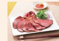
赤身がおいしい ローストビーフ Lean and Tasty Roast Beef