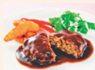
贅沢なデミグラス ハンバーグ Premium demi-glace hamburg steak