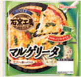
『石窯工房』シリーズ The Ishigama Kobo series