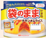
袋のままできる チキンオムライス Chicken Omelet Rice That Can be Prepared in the Bag