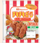
『チキチキボン』 CHIKICHIKI Bone series