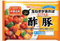
『中華名菜』シリーズ The Chuka Meisai series