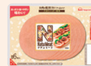
ナチュミート ハムタイプ NatuMeat Ham-type