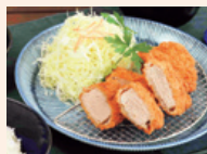
やわらかジューシー うまヒレカツ Tender and juicy pork cutlet