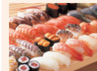
寿司ネタ Fresh seafood