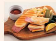
業務用 シャウエッセン ミートローフ Schau Essen Meat Loaf for Commercial-Use