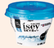
Isey SKYR® (イーセイスキル) Isey SKYR