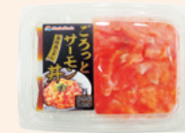
ごろっと サーモン丼 Gorotto Salmon Bowl