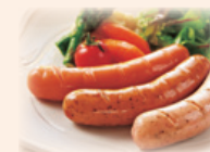
あらびきポーク フランクフルト Arabiki Pork Frankfurters